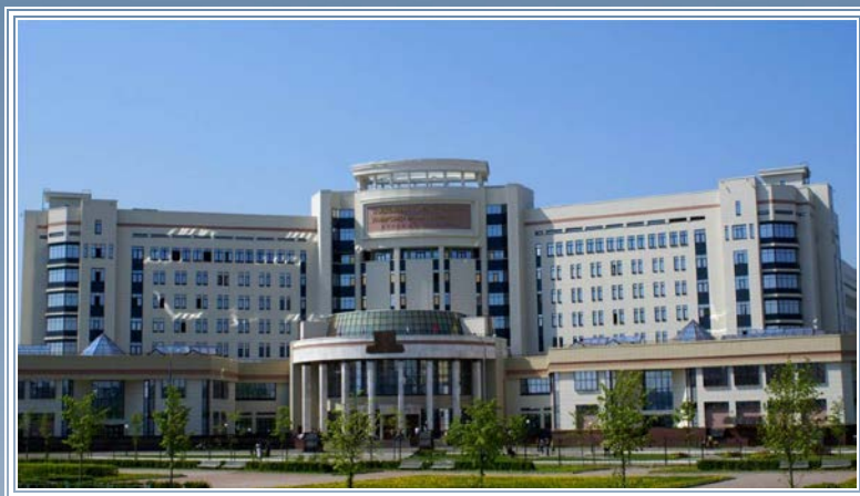
Здание 1-го учебного корпуса на новой территории МГУ им. М.В. Ломоносова (Ломоносовский пр-т, д. 27)

Секретариат Форума: тел: +7 (495) 629-94-23, E-mail: icce2011@yahoo.com