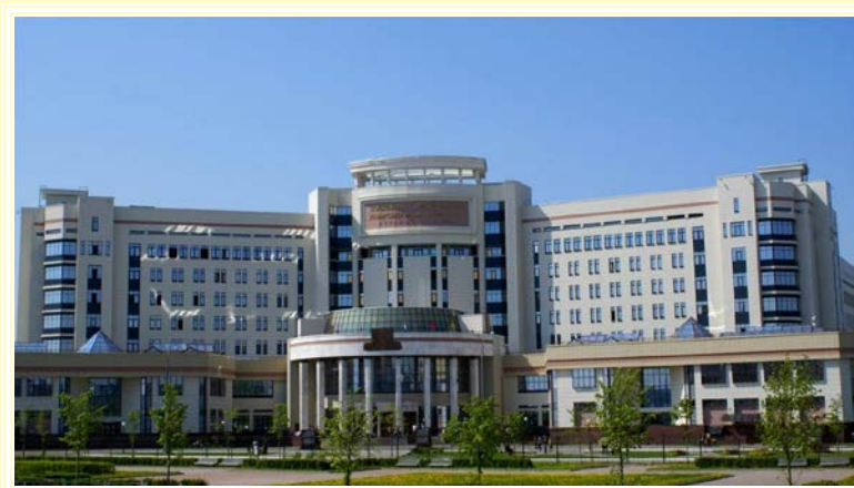
Здание 1-го учебного корпуса на новой территории МГУ имени М.В. Ломоносова (Ломоносовский пр-т, д. 27)

Секретариат Форума: тел: +7 (495) 629-94-23, E-mail: icce2011@yahoo.com